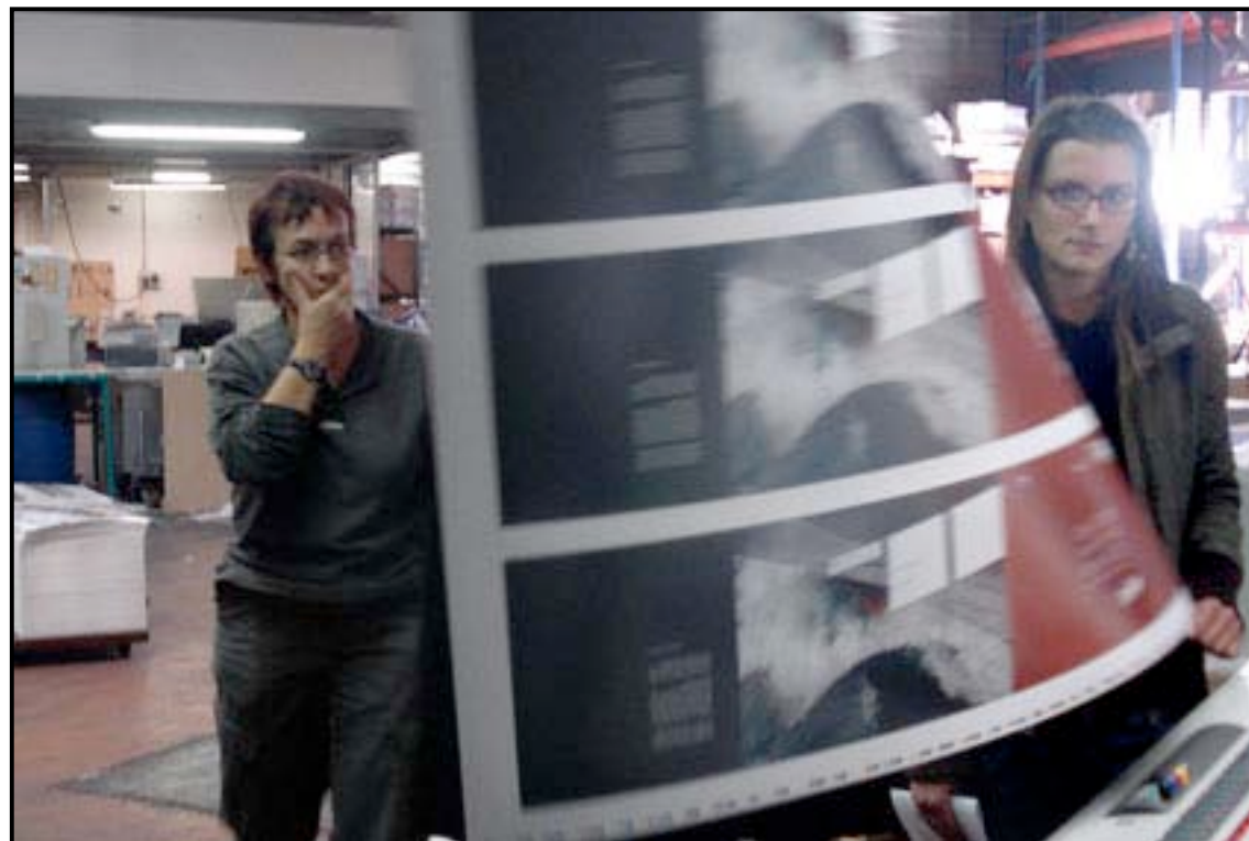
Impression de la couverture.